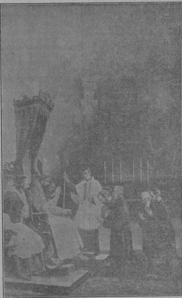
Acto de profesión de los fundadores de la Orden Teatina