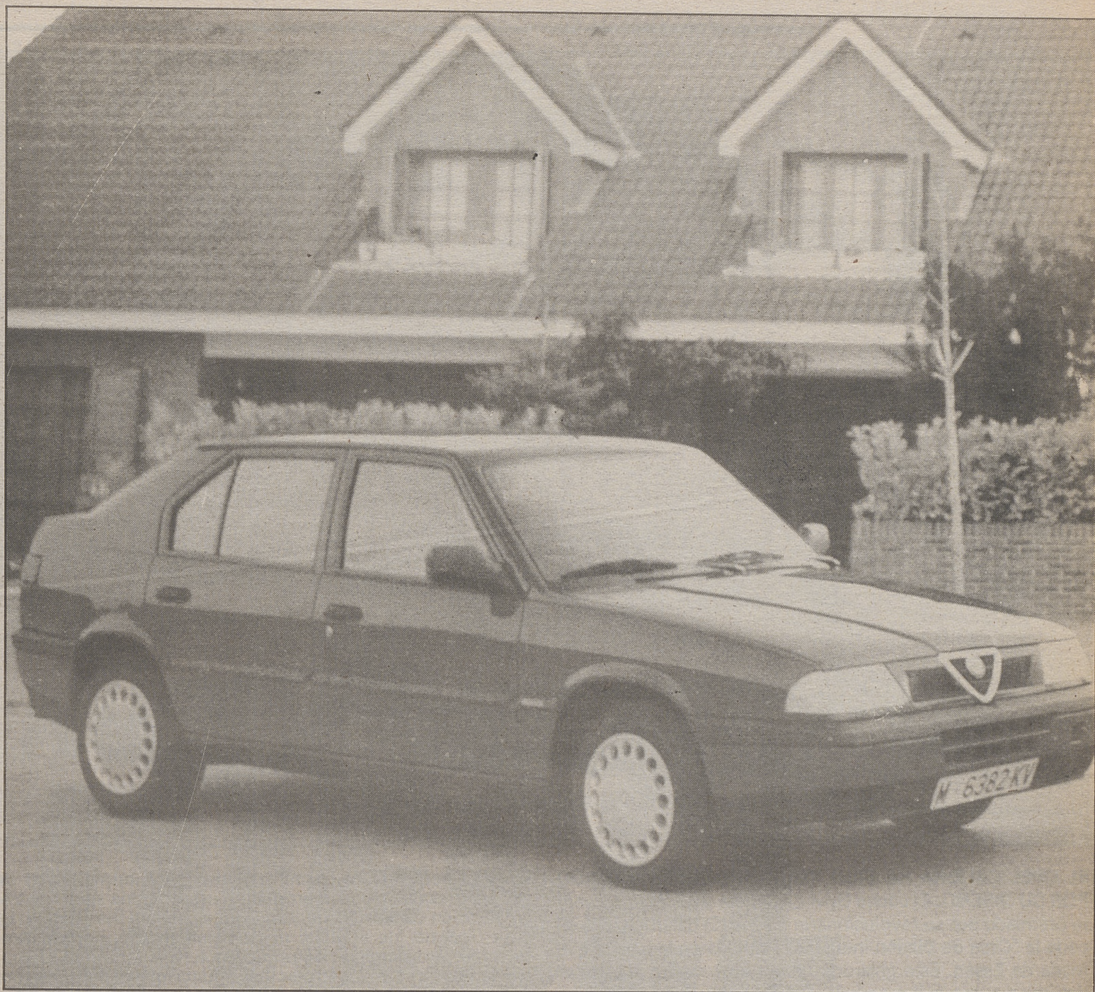
Nuevo Alfa Romeo 33

En cuanto a los Opel Vectra, únicamente suben un 2% las versiones CD y GT. También los precios de las opciones, tanto del Kadett como del Vectra se incrementan en un uno por ciento.