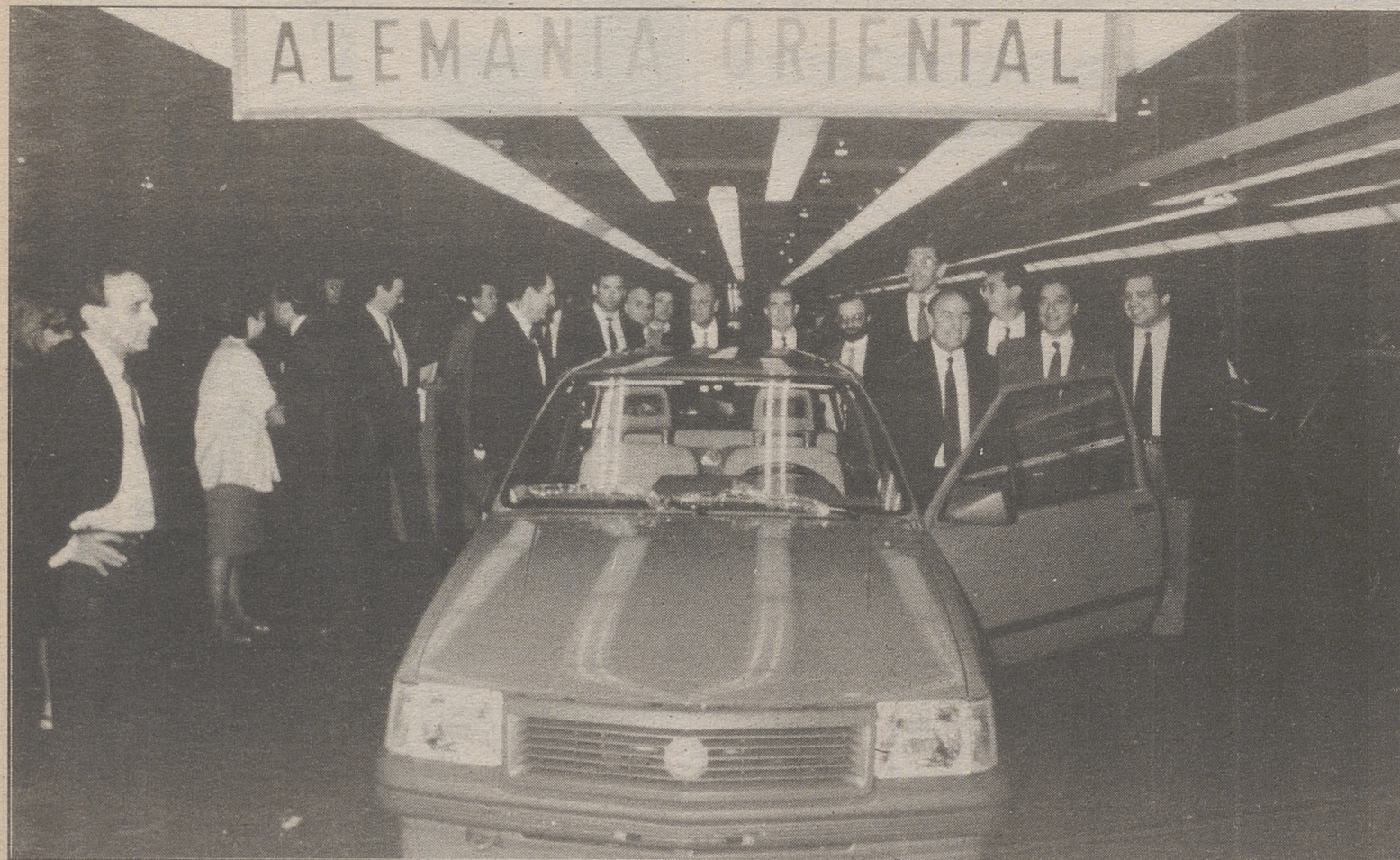
5.500 Opel fabricados en España se exportarán a la Alemania del Este.

"Sin embargo -ha matizado Perversi- no debemos conformarnos con sólo enviar coches. Hay que ofrecer también calidad, algo hasta ahora desconocido por los conductores de esa zona. General Motors España, líder en calidad, ha demostrado en Europa que esa es una de sus premisas.