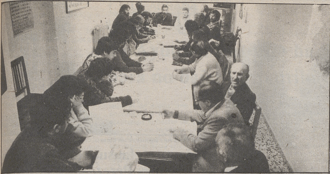
La Conferencia Provincial del PCE se reunió ayer domingo en Avila.