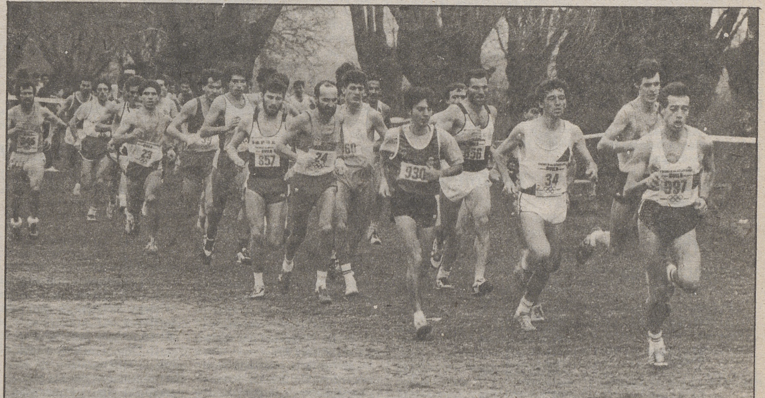
Novcientos cincuenta participantes de seis provincias, en el V Cross Nacional de Avila.