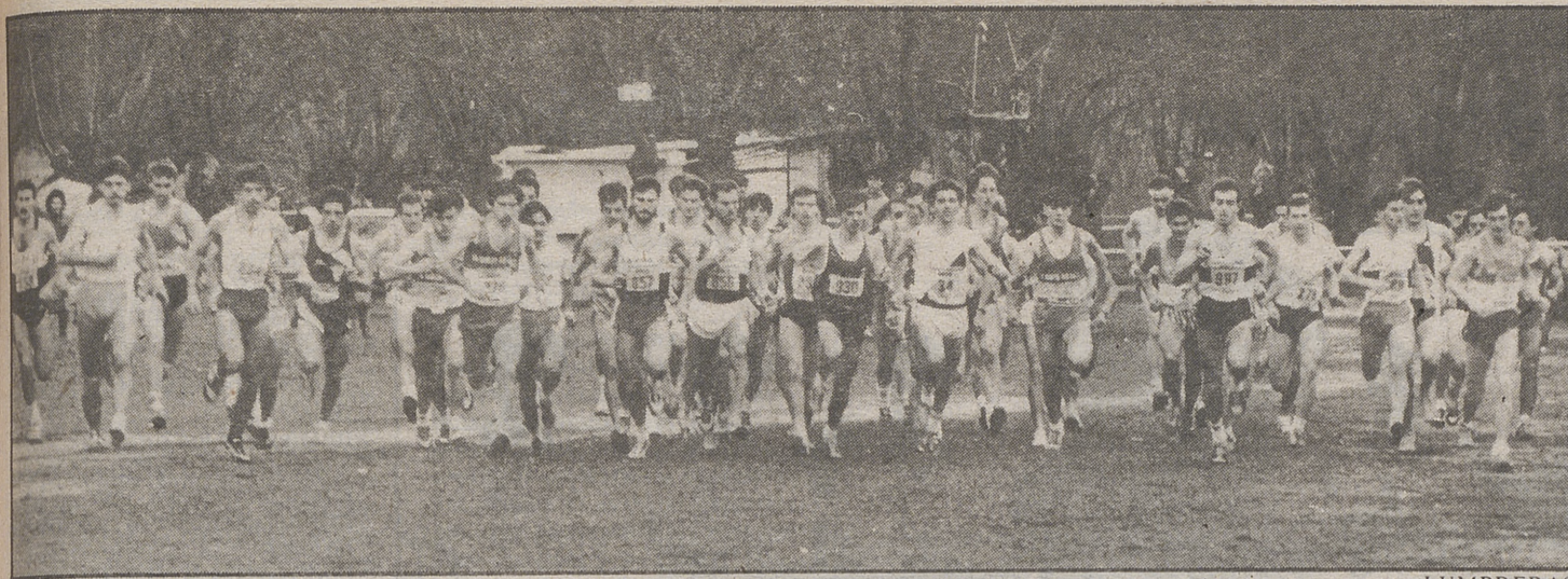
Salida de la prueba senior.