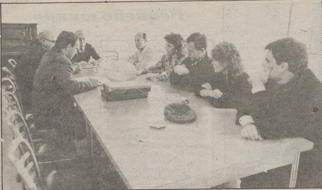
Los periodistas integrados en la Asociación de la prensa festejaron a San Francisco de Sales