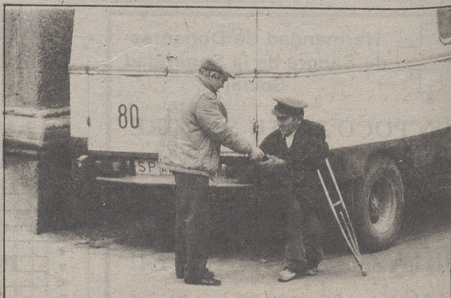
La tarifa establecida (¿por quién?) es el pago al servicio de vigilancia, no al lugar ocupado por el automóvil en el estacionamiento. LUMBRERAS