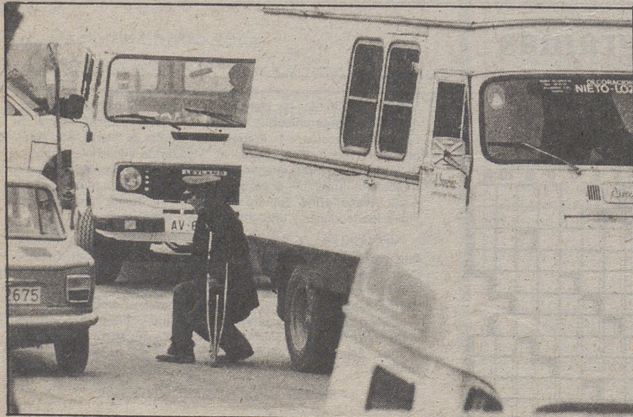
¿Quién asigna a los guardacoches los estacionamientos en los que pueden ejercer como vigilantes? LUMBRERAS

Ante el hecho de la reaparición de estos vigilantes, sería necesario que alguien se ocupara de clarificar cosas, tales como los lugares que puedan tener asignados, cuáles son sus obligaciones (la prestación real del servicio por el que cobran) y cuáles son los derechos del automovilista al que, evidentemente, no se puede obligar a pagar por ocupar un lugar en un estacionamiento público, concepto por el que ya paga su impuesto correspondiente.