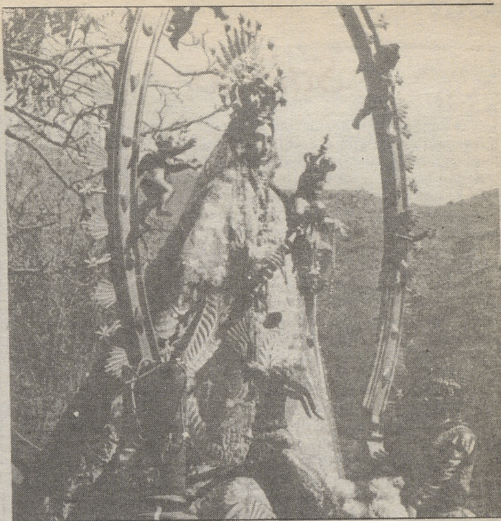
La Virgen de Chilla es venerada por toda la comarca de Candeleda. LUMBRERAS