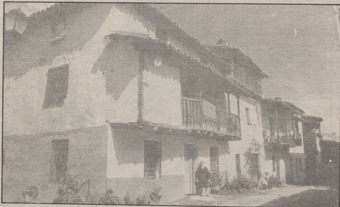
En la conservación del patrimonio también interviene la asociación “Condes de Leda”.

1.—Actos culturales varios, conferencias, charlas, etc.