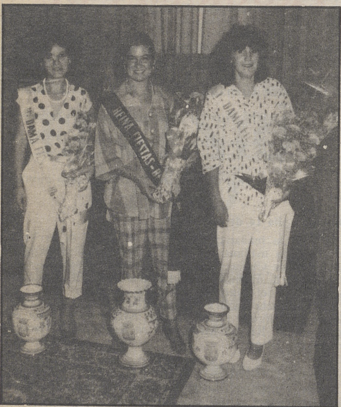
Reina y Damas de las fiestas 86.