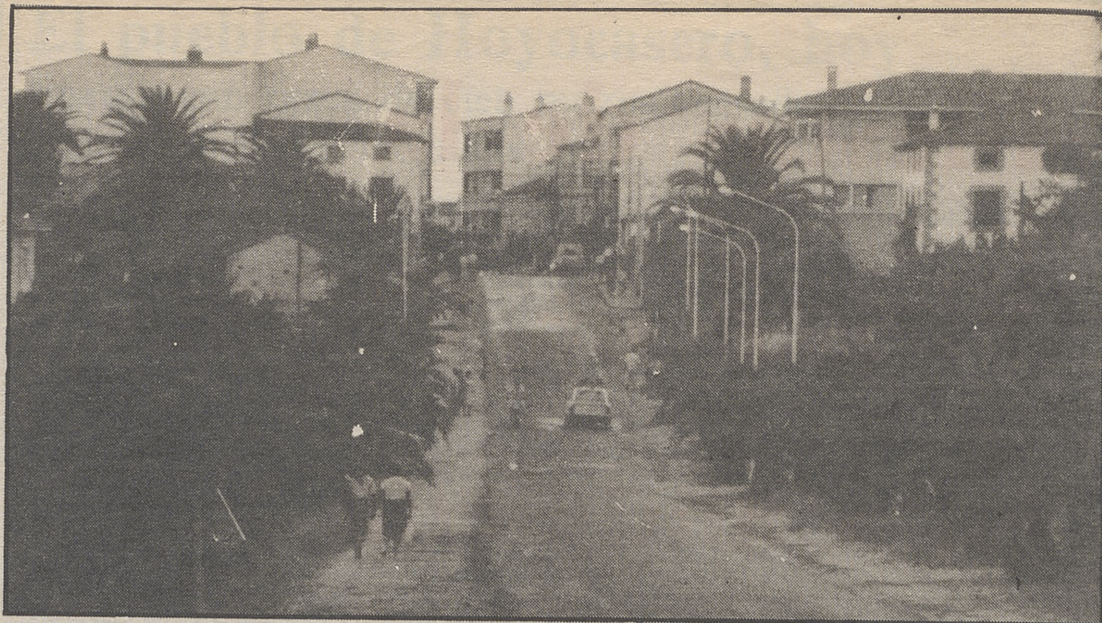
La Avenida de Las Palmeras, entrada de Candeleda.