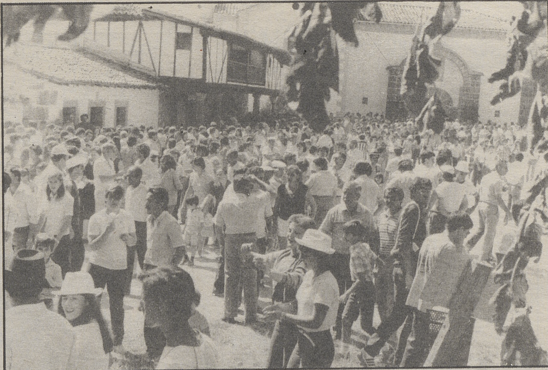
Cientos de personas suben a Chilla el día de la romería.

Buceando en los recuerdos, ante la proximidad de estas fiestas, quiero hacer mención de algunas personas que, especialmente vinculadas a la Virgen contemplarán desde el cielo, pues seguro que de él disfrutaban, contemplarán con alegría inmensa, cómo el amor y devoción a quien ellos tanto amaron, se