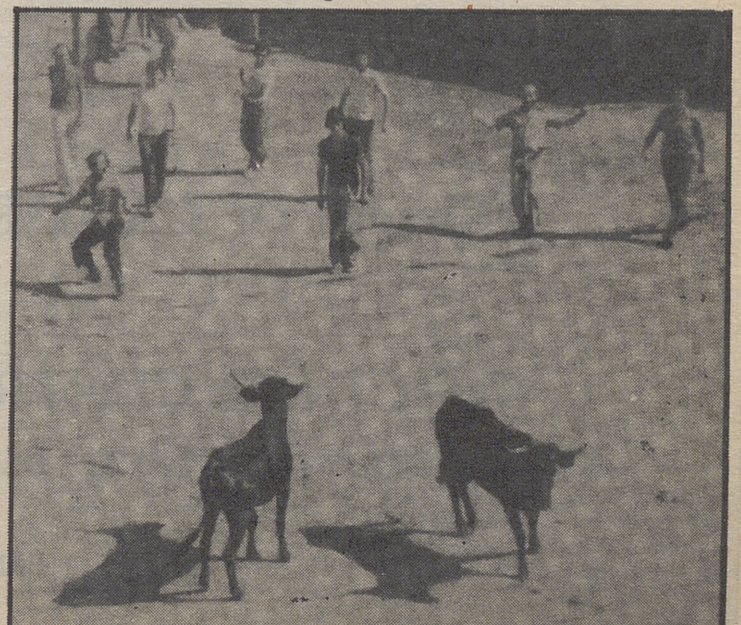
Las capeas siempre estuvieron presentes en las fiestas de la villa.