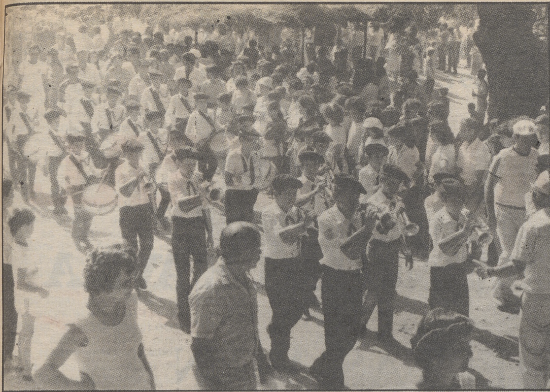
"Alegría Candeledana" cuenta con una Banda de Música, presente en todos los actos.