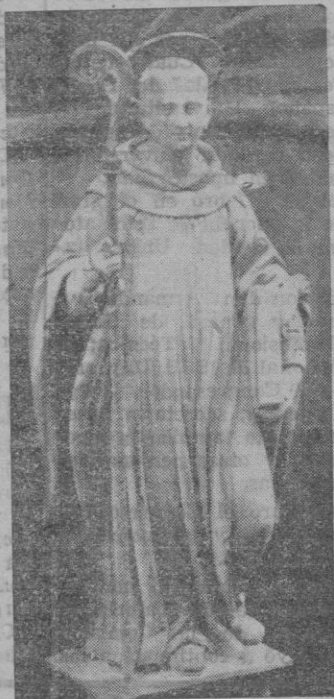
Effigie de San Bernardo existente sobre el portal del oratorio de San Pedro y San Bernardo