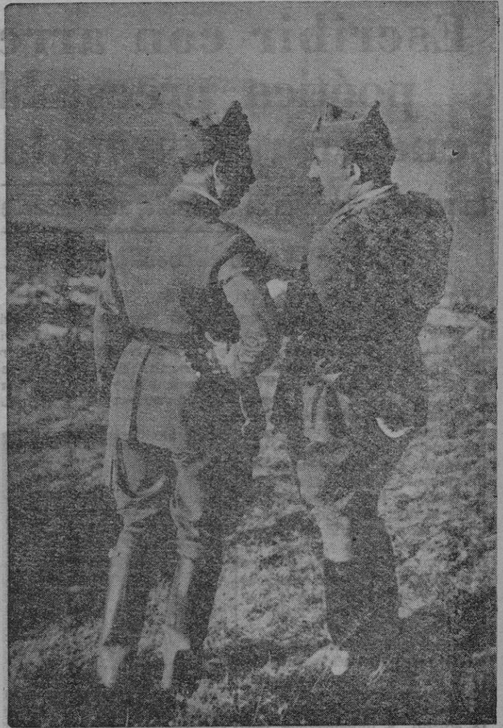
El general Franco dirigiendo juntamente con el general Dávila la campaña del Norte

Para cerrar estas líneas, no cabe más que una frase: ¡Francisco Franco Bahamonde!, «Ad multos annos».