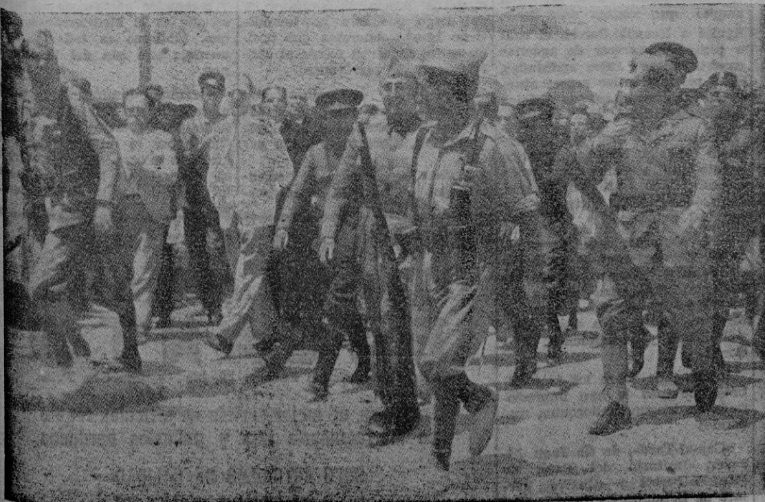
Franco llega a Tetuán para iniciar el glorioso Movimiento Nacional que salvó a España.

En el aniversario que hoy conmemoramos hemos de patentizar al Caudillo invicto, nuestra adhesión inquebrantable, pues si soldados fuimos a sus ordenes en la guerra, pedimos un puesto de avanzadilla en la paz.