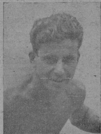
Sinto, el notable proel del snipe vencedor.

En el resto hay alternativas en alarde de maniobras. Es cuan-