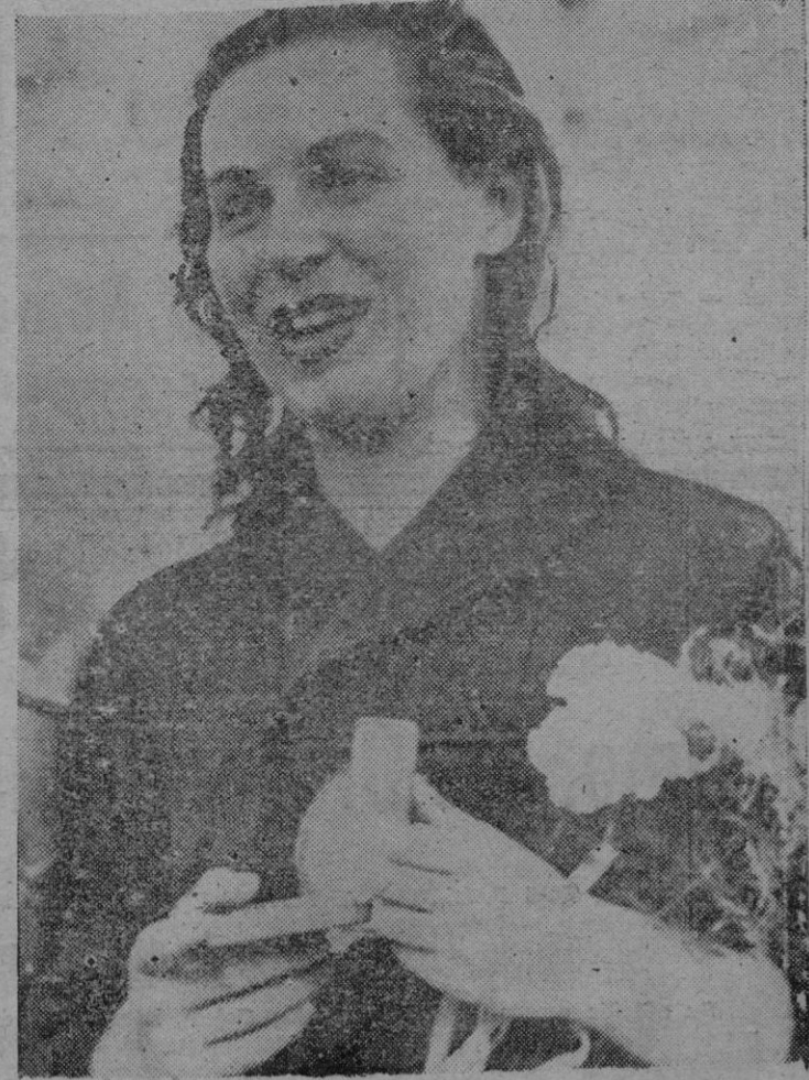
El caso de la nadadora húngara Katalin Szoka demuestra que las mujeres de detrás del «telón de acero» no pueden enamorarse de quien quieren. Campeona olímpica de los cien metros, Katalin se enamoró del nadador norteamericano Bob Hughes. Como el matrimonio con un «capitalista» resultaba inconcebible para las autoridades deportivas húngaras, Szoka fue encerrada en su habitación hasta la hora de emprender el regreso a su nación.