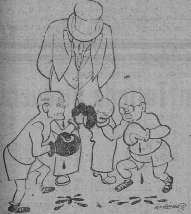
—Para ser ambos del mismo partido, encuentro que se lo toman con mucho interés.