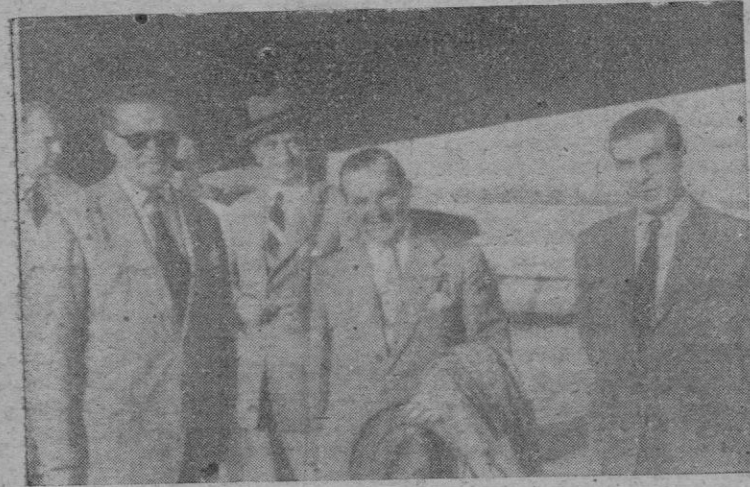
Los señores que forman la comisión de INI, recibidos, a su llegada, por el Delegado Sindical Provincial

—Pues muchas gracias por su amabilidad y, bienvenidos. Los comisionados permanecerán entre nosotros hasta el próximo martes, probablemente.