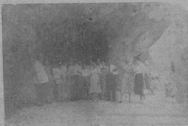
Un grupo de participantes en el Congreso Internacional de Folklore, en la Calobra, antes de entrar en el túnel que conduce a la desembocadura del "Torrent de Pareis"