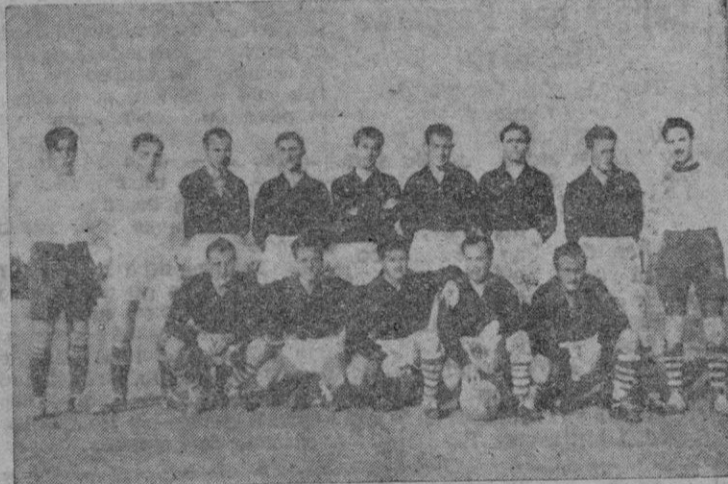
El equipo de la S. Ibicenca

El Llosetense ha causado una buena impresión, pero ha sido superado por el equipo local que ha jugado muy bien técnicamente y con gran entusiasmo los tres encuentros.