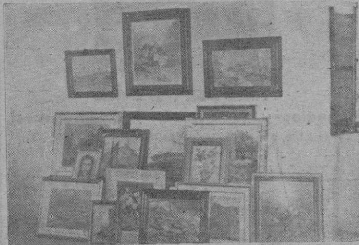
Uno de los grupos de óleos que figurarán en la exposición pro Nuevo Seminario.

En los medios artísticos re- cogimos la noticia de que los pintores mallorquines, y con ellos los peninsulares y extran- jeros que residen habitualmen- te en Mallorca habían decidido hacer una valiosísima aportación en favor de las obras del Nuevo Seminario.