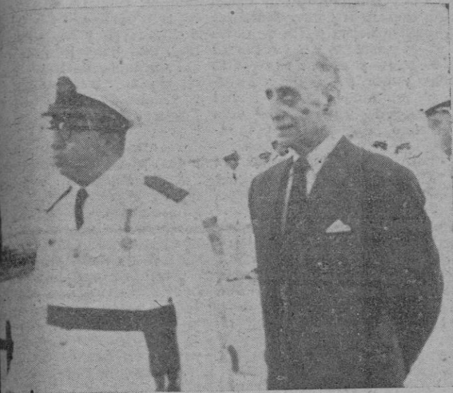
El jefe de la Región Aérea Central, Teniente General González Gallarza, momentos después de su llegada al aeropuerto de nuestra ciudad.