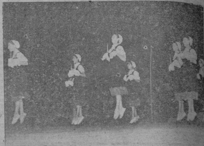
El aplaudido grupo de Pamplona iniciando la interpretación de la danza de las espadas.