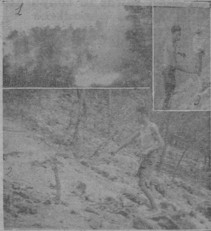
1. El bo que ardiendo. — 2. Ahí se inició el fuego. — 3. Uno de los campesinos cooperando en la labor de extinción.