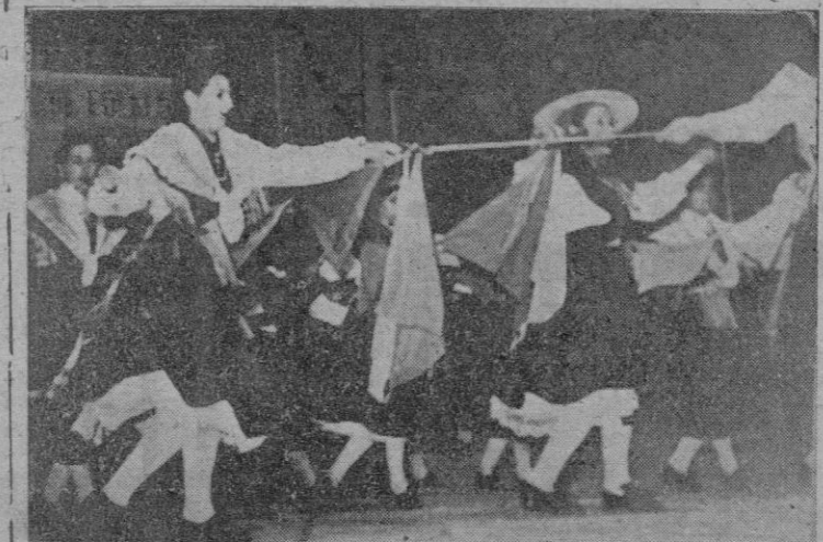
Las componentes del brillante grupo de La Coruña en una de sus más celebradas interpretaciones.