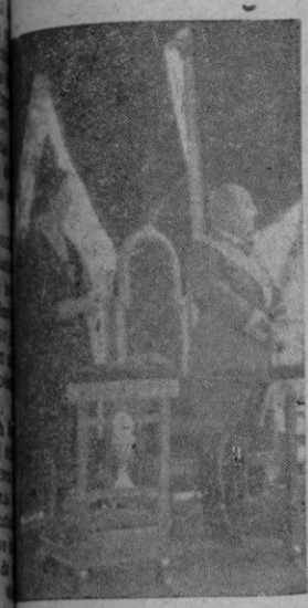
El Jefe del Estado y su esposa asisten al pontifical celebrado por el Cardenal Legado el último día del Congreso

Barcelona, 1 -- El Legado de Su Santidad el Cardenal Tedeschini ha llegado hoy domingo, en el altar pontifical instalado en la plaza de Pio XII el solemnisimo pontifical que ha asistido S. E. el Jefe del Estado, con su esposa, miembros del Gobierno, Presidentes de las Cortes, Cardenales y trescientos Obispos de las Españas y extranjeras. Más de un millón de almas se congregaron a lo largo de la Avenida Generalísimo, en el trayecto comprendido desde el cruce con la Avenida de Carlos III hasta el cruce de los Caídos.