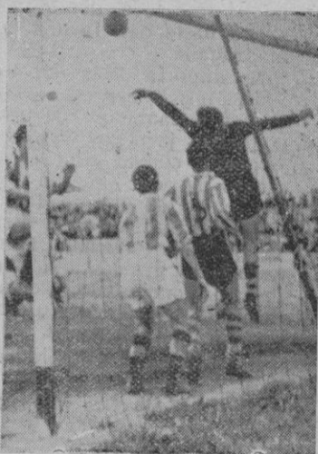
El meta del Alavés despeja con los puños evitando el remate de Marroig

—¿Qué le pasó? —Ya lo vió Vd. lesionado a los pocos minutos. —¿Cómo fué?