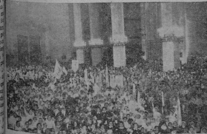
Imponente aspecto que ofrecían las amplias naves de la Catedral durante el acto infantil de ayer

Bajo la dirección del Prelado, jóvenes y niños oraron fervorosamente por la Paz y el Congreso Eucarístico Internacional