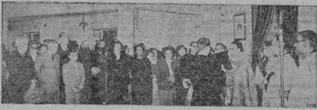
Bendición por el Prelado de la Casa Cuna de El Terreno

Señala la importancia de los actos, en los cuales no son promesas lo que impera sino las obras que se muestran a todos. Compendia lo inaugurado y bendecido indicando la Caridad que se ejerce en la