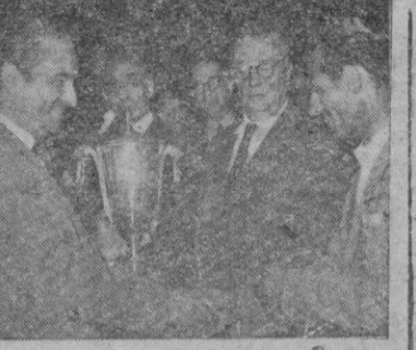
Tres momentos de la entrega de premios, que realizaron nuestras primeras autoridades

para Oficial Sindical Agraria, del Sindicato Vertical de Ganadería y de la Excm. Diputación Provincial de Baleares. Jornada conitísima, a base de un colosal programa integrado por once pruebas.