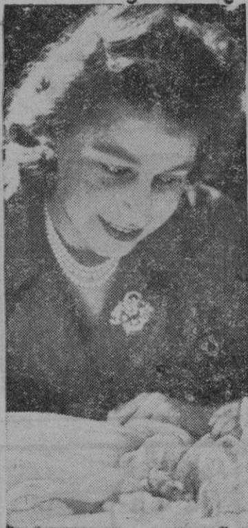
La reina Isabel de Inglaterra contemplando a su último hijo

Asistieron al acto de homenaje los galardonados, ninguno de los cuales sabía nadar, las primeras autoridades, consignatarios y comandantes de buques