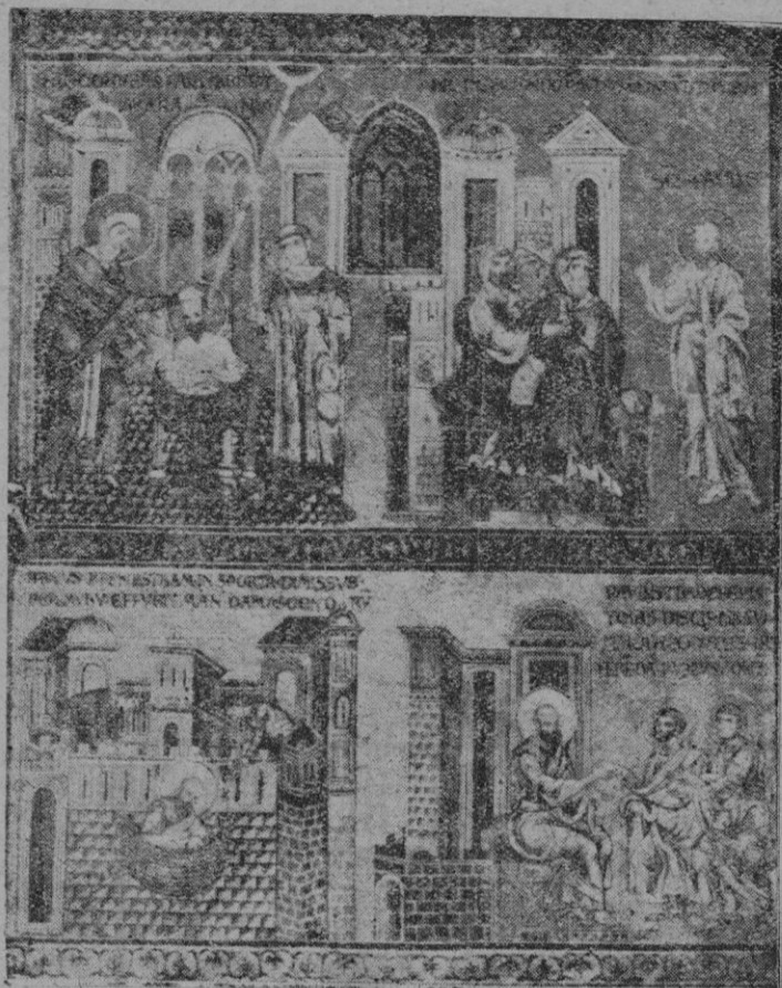
Escenas de la vida de San Pablo representadas en un mosaico de la catedral de Monreale (siglo XII). En primer término su bautismo por Ananías y al lado su predicación ante los judíos. Abajo, la huida de Damasco (el descenso en una espuerta por la muralla); y San Pablo enviando a Silas y Timoteo con cartas a los tesalonicenses.

Tan actual es hoy como el pensamiento y el este mensaje paulino. Periodistas de hoy tienen fuente luminosa de acción y de aliento. Hoy fiesta de la Conversión de Pablo, y vale la pena de todos meditemos la que nos da la conducta primer periodista cristiano.