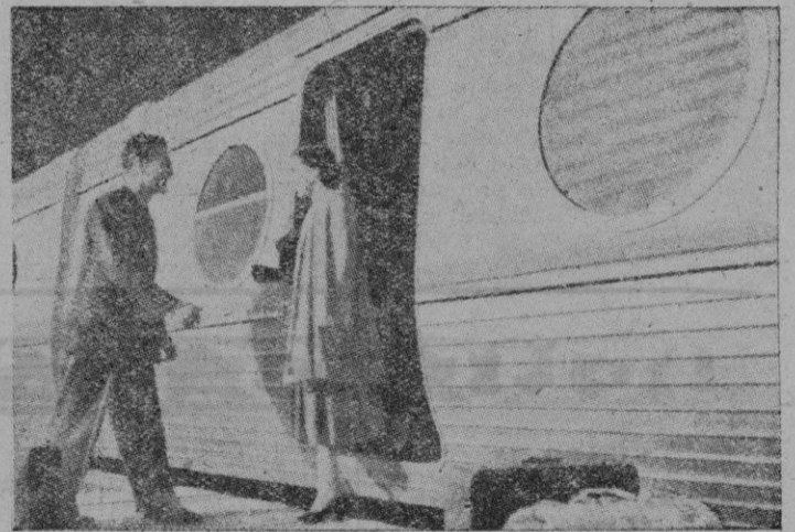
Un aspecto exterior del tren "Talgo"