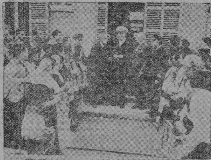
El Almirante Parsons, con el Gobernador y el Presidente de la Audiencia, al abandonar el Hotel Marisob, entre el vecindario del puerto sollerense.

Según nuestros informes la división naval de la VI Escuadra que se halla en nuestro puerto se hará a la mar el pró-