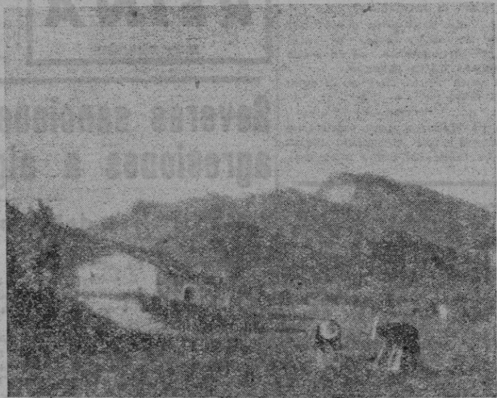
"Labores de escarda", óleo de A. Colom, expuesto en "Galerías Coste"

En las Galerías Sapi... Matias Goeritz expone dibujos sintéticos sobre temas de torero. Su estilo escueto, de buen dibujo, se presta más a las pinturas e ilustraciones que a la obra de caballete. Goeritz es el fundador de la "Escuela de Altamira".