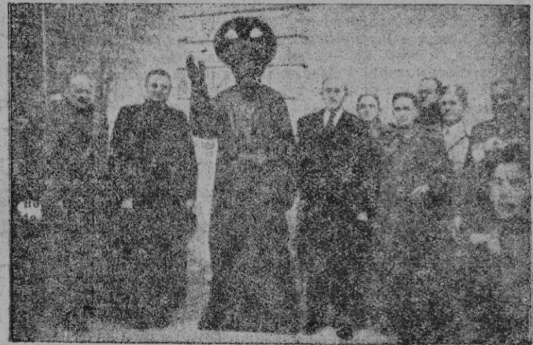
La imagen de San Julián, con las autoridades locales, poco antes de su colocación en la cima del campanario

Una muchacha había sequiada por sus padres un hermoso anillo con de su fíctica cromática ta de la hoguera varios días por ante la desolación de la juventud ninguna jo en el regalo que le hizo. Esperada al ya se acercaba la hora la fiesta por terminada dice se había dado cuenta anillo; previendo en la conversión, ex —¡Dios mío! ¡Que cosa! ¡No tendré más remedio sacarme el anillo!