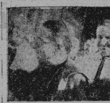
El Excmo. Sr. Obispo al salir del templo parroquial, después de efectuada la bendición de la imagen de San Julián

La transportada desinteresadamente la estatua, que pesa cincuenta y ocho kilogramos, desde Palma a Campos, en