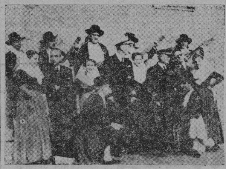
El Almirante Parsons, el Almirante Genova y el Gobernador Civil, acompañados de los componentes de la agrupación folklorica "Parado de Vall-Jemos." después de la exhibición dada por ésta.