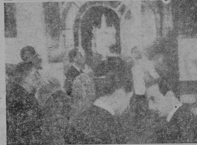
En la foto superior, el almirante Parsons y su grupo de acompañantes oyendo el concierto en las Cuevas del Drach. -- En la inferior, visita del almirante norteamericano y acompañantes al tesoro de la Catedral

El bellissimo salón comedor se hallaba adornado con singular gusto así como la mesa en cuya parte central figuraban las banderas de España y de los Estados Unidos, hechas con ellos.