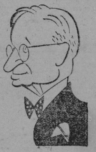
EL PRESIDENTE TRUMAN

la guerra por una parte y el apaciguamiento por otra. El presidente Truman habló en la sesión conjunta del Senado y la Cámara de Representantes. El primer ministro británico Churchill asistió como invitado de honor, al acto que se celebró en la sala de la Cámara. Truman se refirió a sus conversaciones con Churchill en los siguientes términos: "Hemos tenido una serie satisfactoria de entre-