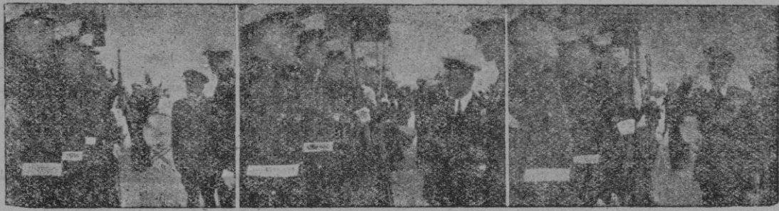
Fotos detalles de la visita del Excmo. Sr. Capitán General, Almirante Jefe de la Zona