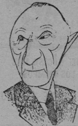
EL CANCELLER ADENAUER

han hecho los Parlamentos francés y neerlandés.