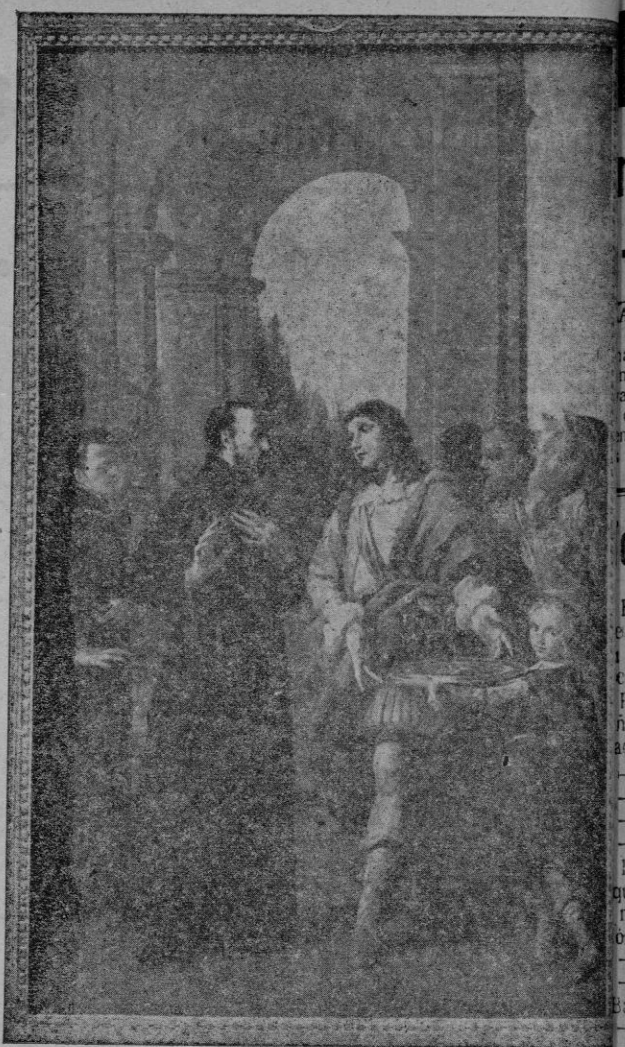
San Cayetano, confiando en la Divina Providencia, chaza gallardamente las cuantiosas riquezas reiteradas ofrecidas por el Conde de Oppido.

Desde aquella fecha iniciáronse los devotos de San Cayetano en aquella iglesia maltesa; esto a pesar, en 1939 al inaugurarse con toda solemnidad la capilla dedicada al mismo, no sólo venía a comenzar oficialmente el culto al gran Patriarca sino que los nombres de teatinos y hierosolimitanos a la par que descendientes de los Grandes Maes-