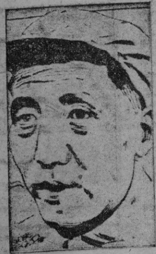
MAO TSE TUNG