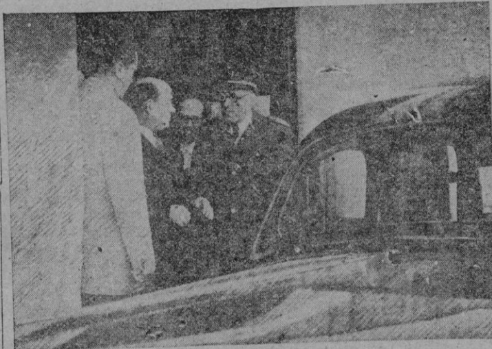
El pasado domingo dimos cuenta, en una información, de la visita que efectuó a la Cárcel Provincial el Ilmo. Sr. Director General de Prisiones. La foto recoge uno de los momentos de esta visita.