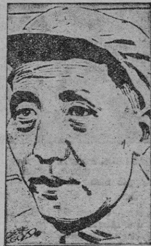
MAO TSE TUNG