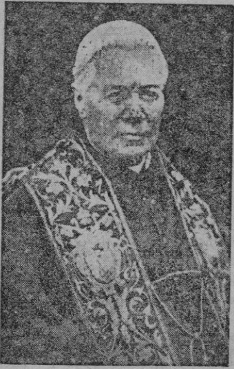
Elección a los altares del Papa Pío X ha sido dado esta mañana al reconocer la Sagrada Congregación de Ritos la validez de dos milagros atribuidos al Padre San

Los dos milagros consisten en la curación milagrosa por su intercesión de dos monjas, una de las cuales vive todavía y se espera que pueda asistir a la ceremonia de beatificación que posiblemente, se celebrará en esta primavera.