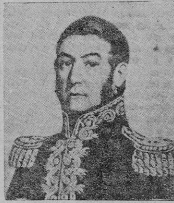
El General San Martín

noamericana es guerra civil entre americanos que quieren, los unos la continuación del régimen español, los otros la independencia con Fernando VII, o uno de sus