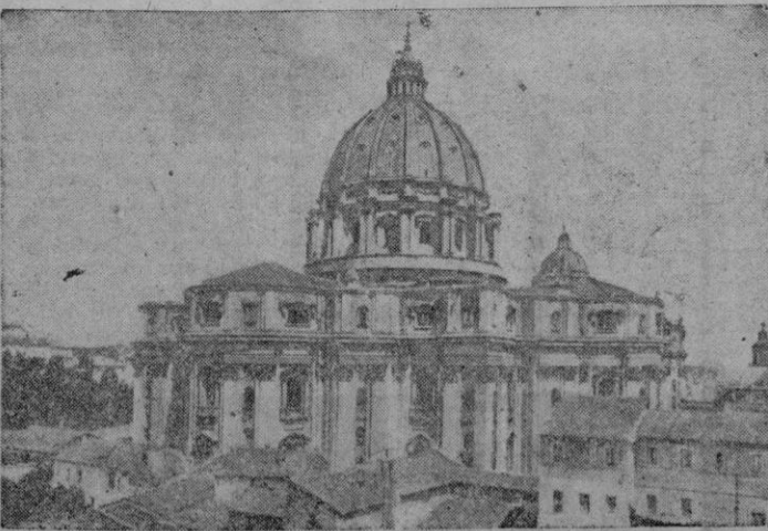
La basilica de San Pedro, que atrae durante este Año Santo miles y miles de peregrinos

También ha venido a Roma otra gran peregrinación de Trieste, presidida por el Obispo de aquella diócesis.