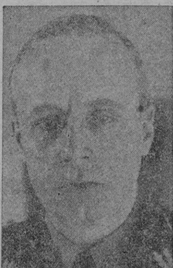
Von Ribbentrop, Ministro de Asuntos Exteriores del Reich

UNA vez perdida la primera y dorada oportunidad, una vez derrotado Graziani, Hitler se decidió a actuar. Haciéndole ofrecido a Mussolini algunas unidades de tropas, y habiendo indicado—asunto delicado para tratar entre dictador y dictador—la conveniencia de dar un mando alemán a las tropas italianas, optó por la inmediata toma de Bardia y comunico a los jefes de su Estado Mayor que estaba resuelto a hacer cuanto estuviese en su poder para evitar que Italia perdiese el norte de Africa.