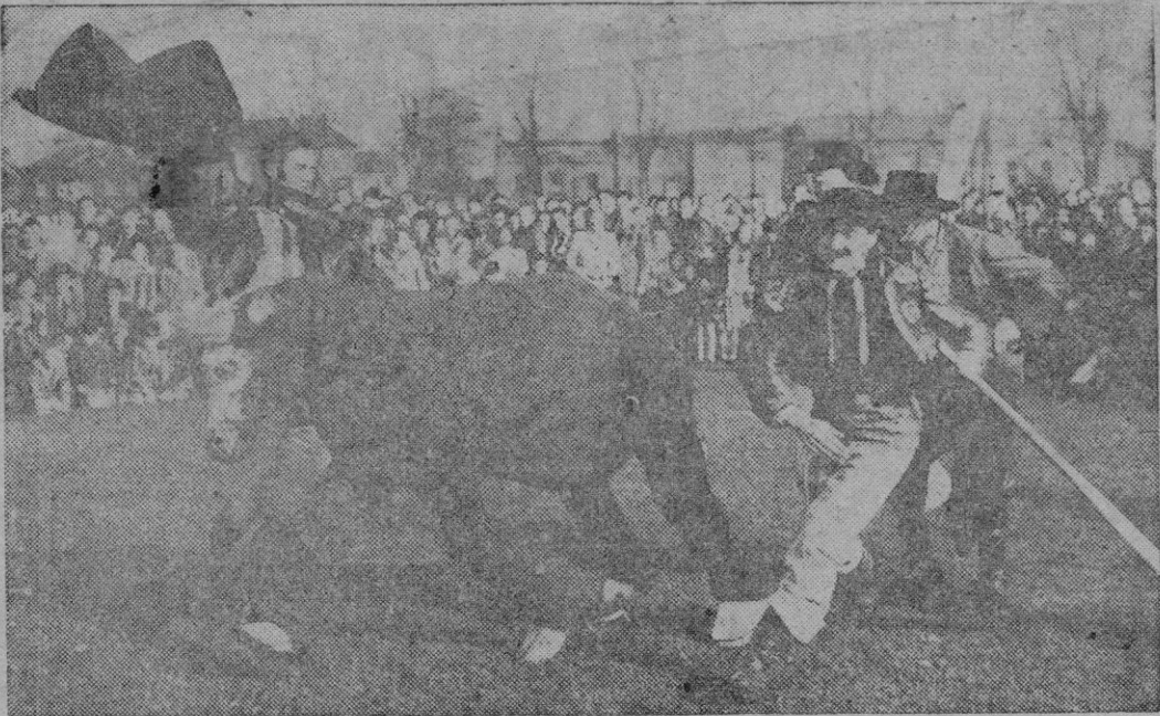
Esta corrida, naturalmente, no es en España, porque en España se torear toros de verdad. Sin embargo creemos que fué un éxito en el lugar donde se celebró. Público, "toreadores" y hasta el "toro" se divertieron de lo lindo.