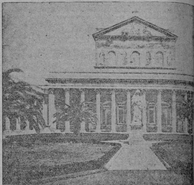
Atrio y fachada de la basílica de San Pablo extramuros.

fulgia bañada en un crepúsculo de plata, no teníamos ante la vista el modesto Oratorio de San Anacleto, ni la suntuosa Basílica edificada más tarde por Constantino, ni siquiera el templo magnificentísimo que mandaron levantar después Valentiniano II, Teodosio y Arcadio, que un incendio apocalíptico destruyó casi totalmente en la infausta noche del 15