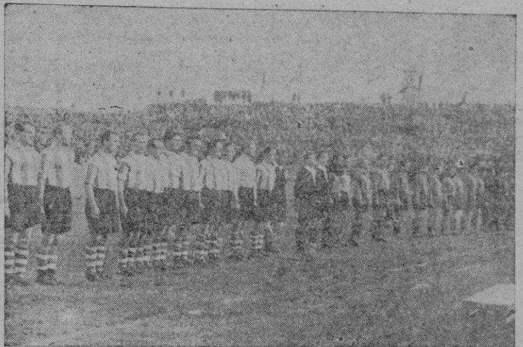
Alineados frente a la tribuna, los jugadores daneses y españoles, con el árbitro y los jueces de línea, escuchan los himnos nacionales, antes del comienzo del partido internacional de ayer tarde en Es Forti

MALLORCA: Caldentey; Suñer (Fernández), Urcelay, Perales; Pancho, Pomar (Rullán);