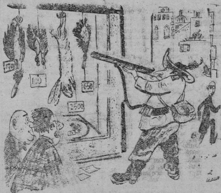
HONRILLA DE CAZADOR

—Siempre dispara previamente sobre las piezas que compra. (De "Marc'Aurelio" Roma)