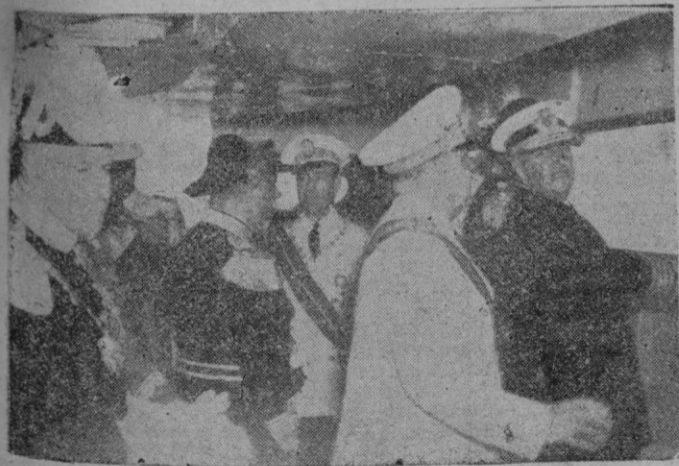
El Jefe del Estado español a bordo del crucero "Miguel de Cervantes"

Lazos permanentes son los que unen a Portugal y España, lazos forjados en siglos de historia, en comunidad de grandes ideales y de grandes empresas. Así Franco ha podido dar a la colonia española residente en Lisboa la calidad de representación viva de esta hermandad íntima.