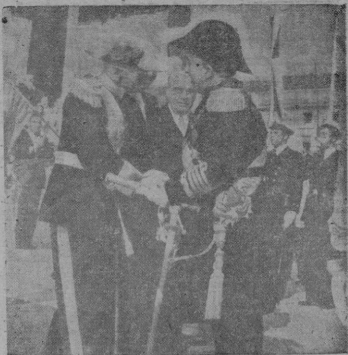
El Jefe del Estado portugués, mariscal Carmona, saluda al Caudillo de España, Generalísimo Franco, en el momento de desembarcar en el muelle de las Columnas de Lisboa