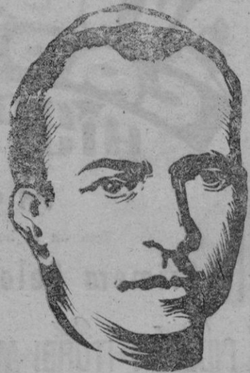
EL CARDENAL CEREJEIRA

materialista como capital humano no se le podrían discutir sino aquellos otros superiores que le debemos en cuanto es nuestro prójimo, hecho a imagen y semejanza de Dios.