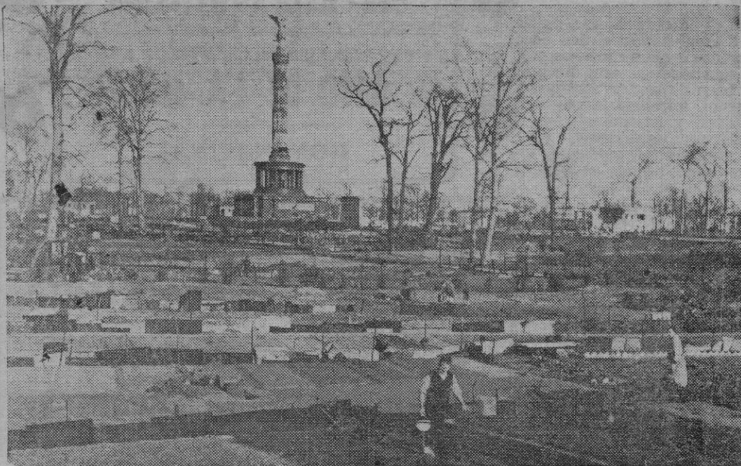
La ciudad de Francfort se va rehaciendo, pero también en ella sucedió lo que en Berlín, al convertir los jardines de árboles mutilados en pequeños huecos.

En este gigantesco crecimiento de Francfort se reflejan el ritmo y las circunstancias de la vida en los últimos años.