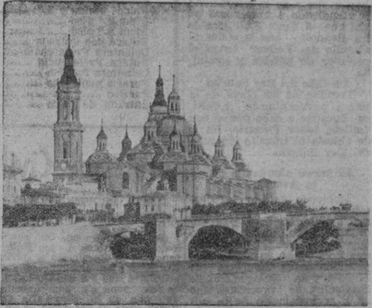
La basílica zaragozana del Pilar

entusiasmo y valentía de los defensores. Y de aquella sena- lada victoria resultó el glorio- so empeño de los zaragozanos de no entrar en pacto alguno con el enemigo y resistir hasta el último aliento. Palafox, convencido de que no era dado con tropas bisonas combatir ventajosamente en campo raso y de que sería más útil su ayuda dentro de Zaragoza, de terminó meterse con los suyos en la ciudad. A una hora se- ñalada, se pobó el aire de un