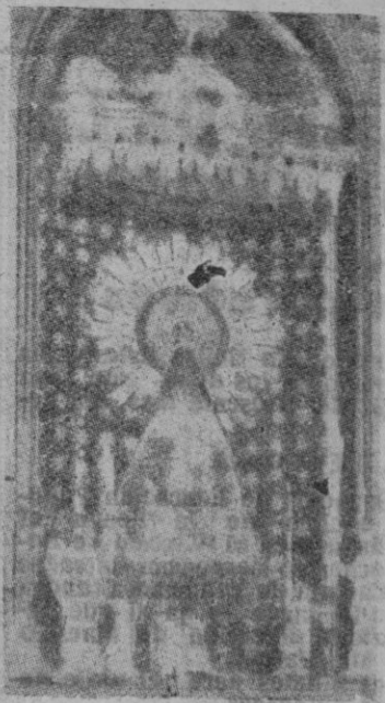
LA VIRGEN DEL PILAR

Es excepcional el valor histórico de Aragón en el complejo hispano, desde que con Jaime I comienza la verdadera ítica con el Islam. En sus rutas están situados los santuarios de la Raza (cruciales para el lejano sepulcro del Apóstol), como el Real Monasterio de San Juan de la Peña, cuna de la reconquista aragonesa, panteón de sus primeros reyes; el de San Pedro de Siresa, donde el conquistador de Zaragoza recibió austeridad y vigor; el Monasterio de Sijena, monumento nacional; el castillo de Loarre, conceptuado el mejor de España de arquitectura románica, monumento nacional; el parque nacional de Ordesa, el Moncayo de la Celtiberia, "Sitio Nacional", ce lebrado ya por Marcial; la catedral de Jaca (donde situó su corte Ramiro I), la más anti- gua de España; el templo de San Miguel de Foces, monu- mento nacional, con pinturas murales, y tantos y tantos si- tios de esta recia región ara- gonesa, que, juntándose con Castilla, sería punto de parti- da de la unidad nacional. Pe- ro, por encima de todo, Ara- gón, Zaragoza, es el Pilar en lo religioso y los Sitios en lo heroico, que se alzan en alas de la fe y de la fama sobre sus catedrales, monasterios, casti- llos y pueblos vocaderos.