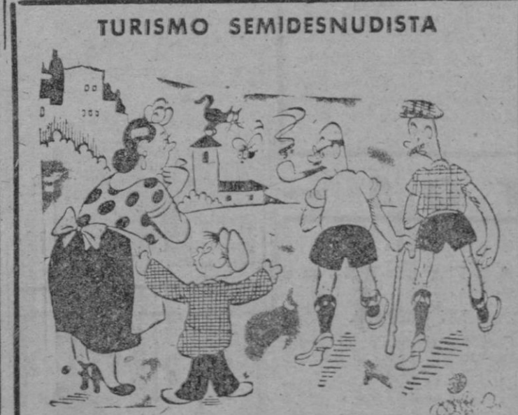
—Mamá: ¿cuándo me vas a poner a mí de pantalón corto? (De "Ideal", de Granada)

LONDRES, 12. (Efe). — La Agencia Reuter comunica desde Buenos Aires que el Dr. Bramuglia, Ministro de Asuntos Exteriores argentino, ha presentado su dimisión al presidente Perón. Añade la citada agencia que la dimisión del doctor Bramuglia se atribuye a diferencias entre él y varios embajadores argentinos. Otra noticia afirma que no es oficial la noticia de la dimisión del Ministro de Asuntos Exteriores argentino.