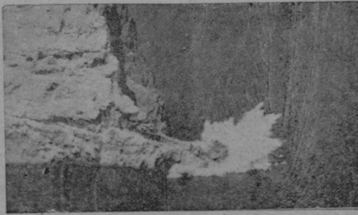
Momento de la explosión

Sin embargo, todas las dificultades fueron superadas. El esfuerzo se sumó al esfuerzo y el interés en que esta obra se llevase a cabo arraigó en todos los espíritus y gracias al celo de nuestra primera Autoridad el Excmo señor Gobernador Civil y Excmo señor Gobernador don José Manuel Pardo