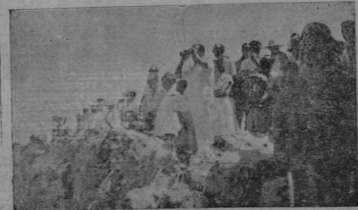
Un grupo de espectadores y periodistas