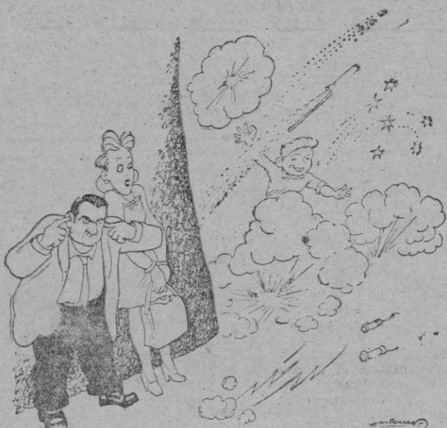
—¡Qué espanto! Ni tranquilos se puede ir por la calle...