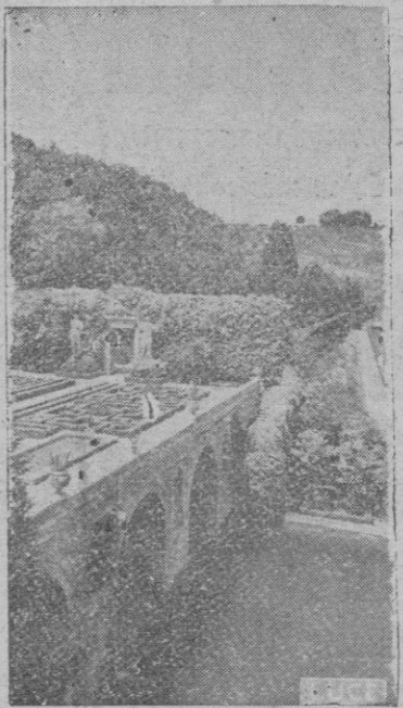
ROMA. — Un aspecto de los hermosos jardines de "Villa Madama"

puede ser más razonable: en la actualidad, previa a la lucha política, hay planteada otra batalla más íntima y más decisiva. Es la lucha del marxismo contra el cristianismo;