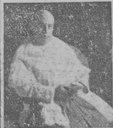
Don Miguel Costa y Llobera.