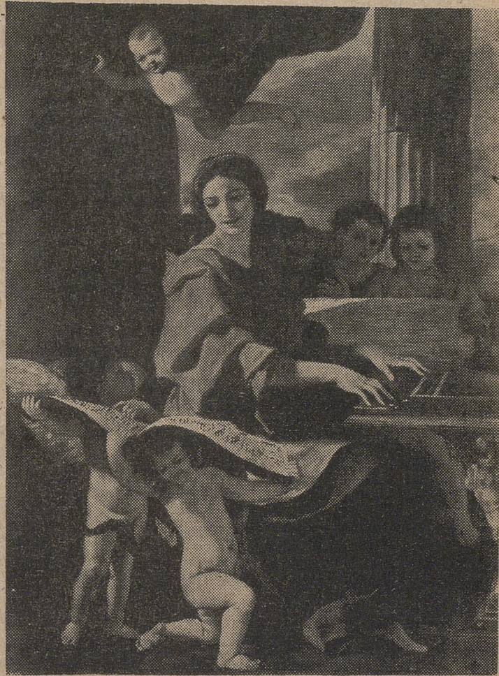
SANTA CECILIA.— Cuadro del pintor francés Nicolás Poussin (1594-1665). Fue pintor de cámara de Luis XIII de Francia. Rivalidades cortesanas le obligaron a abandonar París. Marchó a Italia. Los temas de sus cuadros son bíblicos y del mundo grecorromano. En ellos apunta ya el gusto neoclásico: su estilo ejerció gran influencia en los pintores de la época neoclásica.