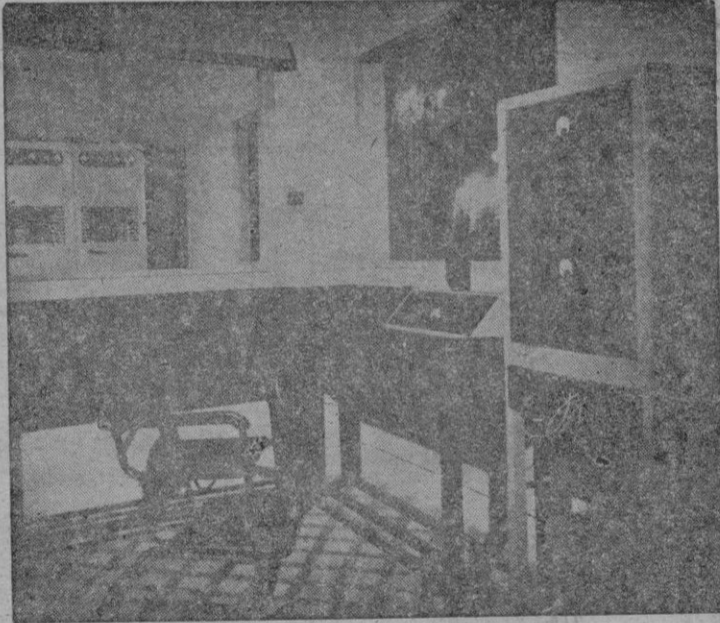
Un detalle del locutorio

Mañana vibrará en el éter, con un programa extraordinario que habrá de prolongarse el lunes y el martes, la voz de la remozada EAJ 13.