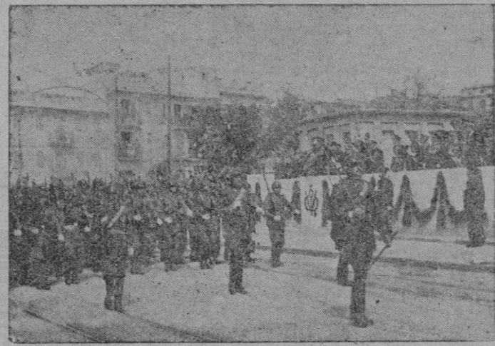
Arriba: Aspecto magnífico que ofrecía la explanada de los Héroes del Crucero Baleares durante la misa de campaña. — Abajo: el desfile de las fuerzas ante el Excmo. Sr. Capitán General y demás autoridades.