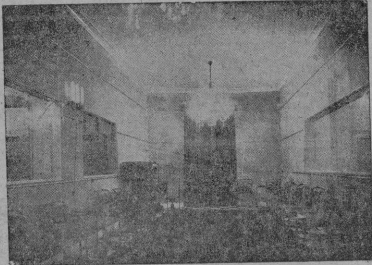
Vista parcial del estudio grande de la Emisora. A la derecha se ve parte del gran ventanal que da al "auditorium"; y a la izquierda, el del locutorio y el de la sala del equipo emisor.

La emoción de unos mallorquines residentes en el Extranjero