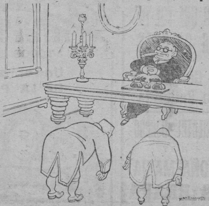
—Excelencia, hay unos diplomáticos extranjeros que vienen a devolver un acortizado. —Súbalo al desván.