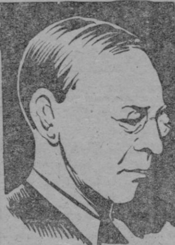
Sir Stafford Cripps

Entretanto, el Estado de Israel aparece en el horizonte como un Estado satélite de los soviets, en perfiles cada vez más acusados. Hasta ahora se mantenía, con hábil y astuta precaución, entre sombríos bastidores, con objeto de no estorbar o entorpecer el apoyo norteamericano a los judíos. El envío de armas y aviones a través de Checoslovaquia era una forma indirecta de ayuda que era estúpido atribuir solamente a una generosidad de los rusos y sus satélites. Ahora, consolidado el poder del Estado de Israel sobre tierra de Palestina, paralizada la lucha armada y estrangulado el tomir-