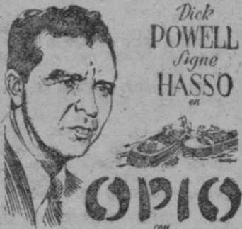
Dick POWELL Signe HASSO

HOY Otra gran exclusiva de nuestros locales "Una película im- presionante por su realismo!!"