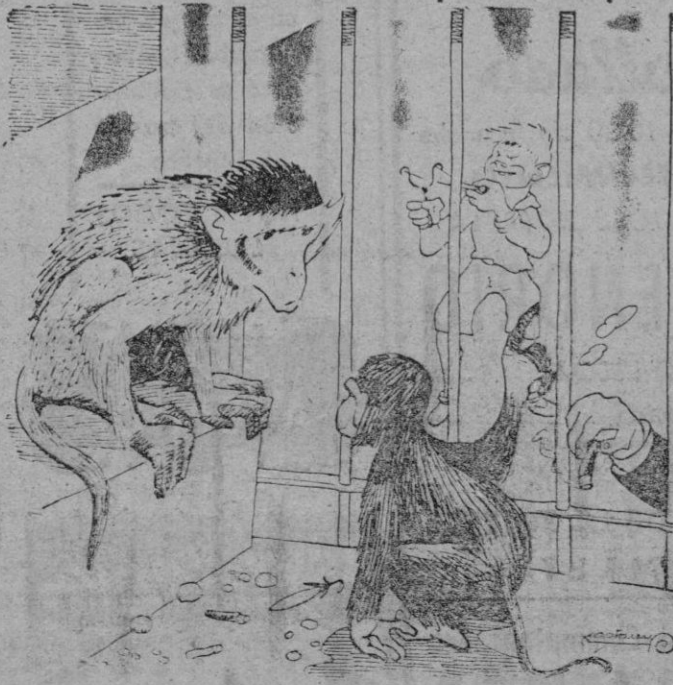
—Ahora imagínate tú lo que ocurriría si suprimían las rejas.