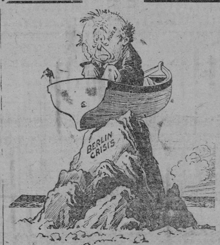
El mundo detenido sobre el escollo. (De "The New York Herald Tribune")