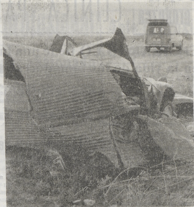
En el estado que puede apreciarse en la fotografía quedó el Citroën matrícula AB-22.840, después de chocar con un camión en el kilómetro 200 de la carretera de Alicante a Madrid, en las cercanías de Aranjuez. El conductor resultó con heridas graves.