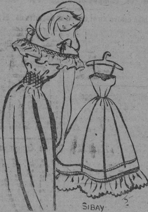
1. Camisón en fina batista rosa, con cintura y volante adornados con nidos de abeja. Tirant es del mismo género. — 2. Combinación en batista; falda realzada con piezas con forma y pequeñas pinzas

Las pocas faldas de tubo que veremos la próxima temporada irán acompañadas de las combinaciones hasta ahora en uso, acampanadas, pero también larguissimas.