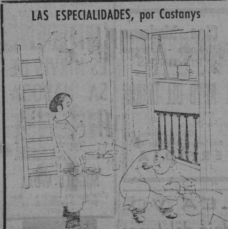
—Al zócalo y a las maderas hay que darles dos capas al óleo. —Perdone, pero yo soy acuarelista.

La prensa gubernamental acusa abiertamente al Prímad húngaro de incitación a las masas católicas en contra del régimen democrático.