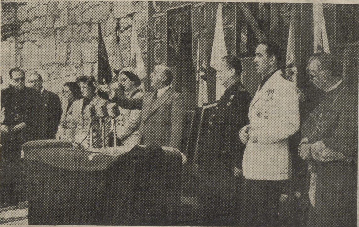
Franco en Las Navas del Marqués.