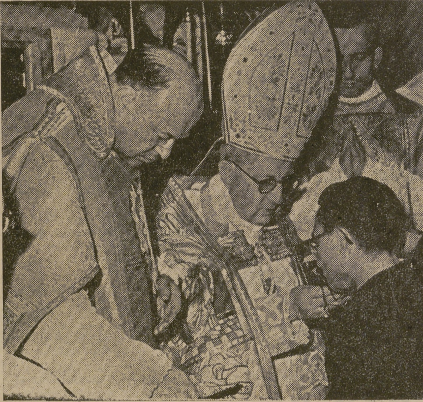
El Emmo. Sr. Cardenal Arcadio Larraona, impone el crucifijo a jóvenes Misioneros del Inmaculado Corazón de María

tos cargos y cometidos de diversa índole ha desempeñado u ostenta en la actualidad, el Eminentísimo y Reverendísimo Sr. D. Arcadio Larraona,