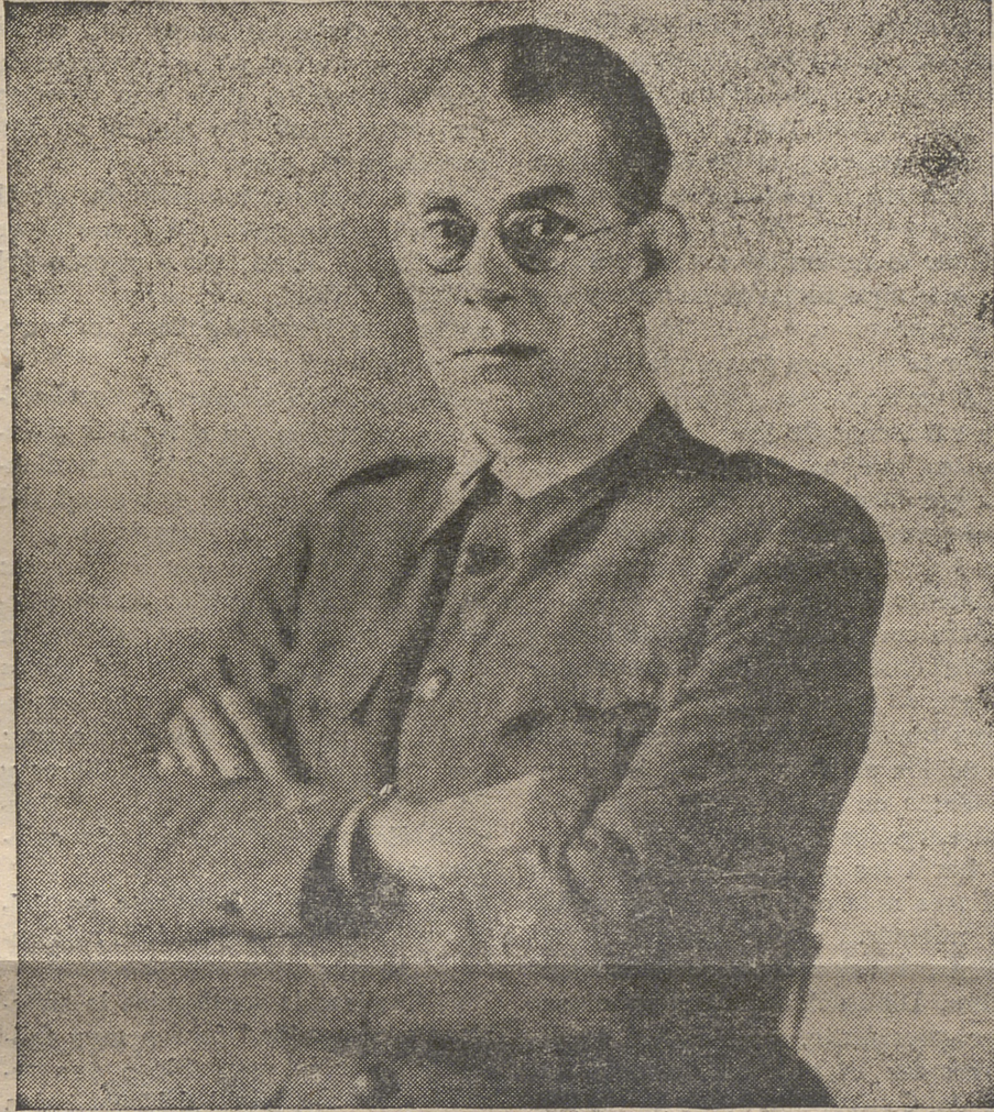
El excelentísimo señor don Emilio Mola Vida', director general de Seguridad en los finales de la Monarquía, se convirtió luego en conspirador para salvar a España.