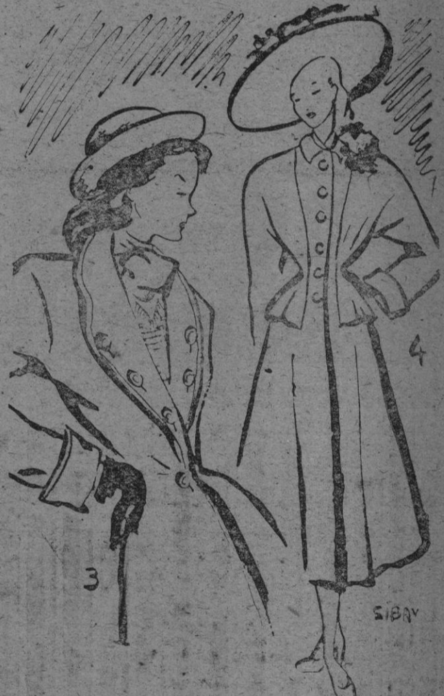
3. En lanilla gris con gran solapa smoking, sujeta con botones. Plisados en piqué blanco. Chaleco gris. - 4. Modelo de entretiempo en falda negra. Flores y ribete del escote en piqué blanco.