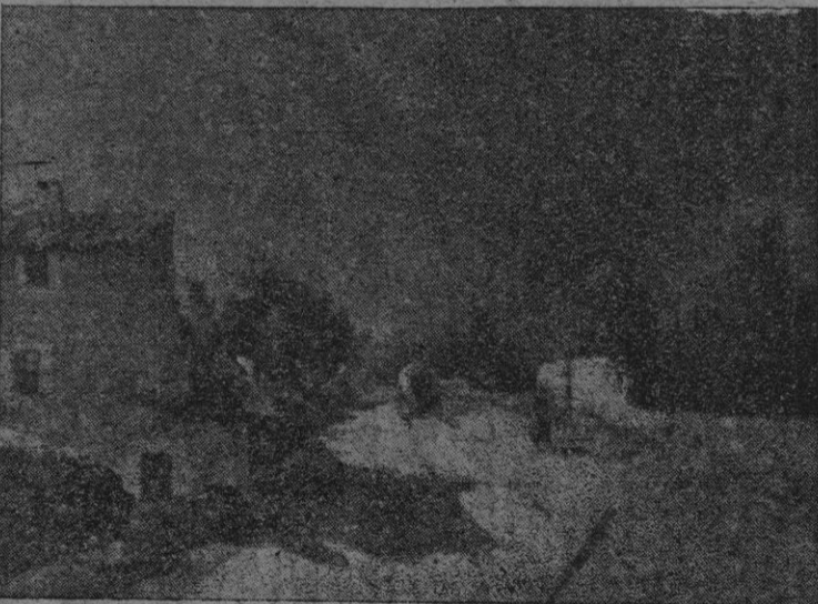
"PAISAJE DE SOLLER", óleo de VENTOSA

Agustín es una bella expresión de un viejo rincón urbano en el cual se conjugan el dibujo austero con un colorido de gran severidad descriptiva.