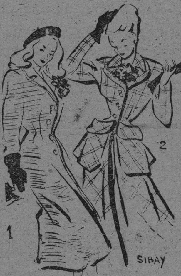
1. Abrigo de entretiempo azul y blanco. Doble solapa y ribete en piqué blanco, a lo largo del cuello. - 2. En tejido de gales con doble cuello. Flores artificiales en el escote. Falda acampanada y orginales bolsillos.

No tenemos seguridad de que nuestros modistos coincidan con los del extranjero. En todo caso muy pronto nos convencemos y nada habremos perdido con saber lo que va a pasar más allá de nuestras fronteras.