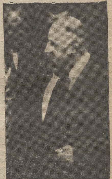
El Presidente de Francia, Charles De Gaulle, abordado por los periodistas.

Dijo que Francia debe seguir siendo el «efectivo aliado de Estados