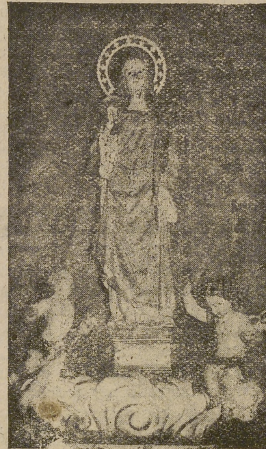
ERMITA DE SAN SEGUNDO