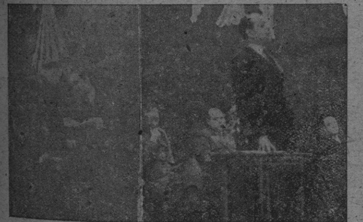
Dos aspectos del brillante acto celebrado ayer. En el primero se ve al Excmo. Sr. Gobernador Civil entregando las credenciales; en el otro, el Vice-Secretario de Ordenación Social pronunciando un discurso.