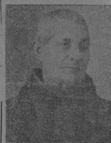
Figura simpática la de este sencillo religioso a quien cabe la gloria, pese a su humildad, de haber sido el fundador de la Tercera Orden Regular de San Francisco en Mallorca y el restaurador de la misma en España.

Muchos todavía le recuerdan pues falleció en 29 de Mayo de 1916, a los 77 años de edad después de una vida ejemplarísima tanto de seglar como de religioso. En Lluchmayor no se ha perdido aún la memoria de aquel devotísimo joven que, aun antes de comenzar el servicio militar, comenzó por instituir la Congregación de Jesús, María y José, que vive algunos años como hermano coadjutor en la Misión, que instalaba más adelante en su propia casa a los congregados y luego traía la congregación a otro local más capaz donde alterna el mismo su labor de tejedor con la enseñanza del catecismo y de las primeras letras; que finalmente pasa con sus primeros compañeros al convento de San Buenaventura, donde se cohesion los miembros de la nueva fundación franciscana, preludio de la provincia de la Inmaculada Concepción de la Tercera Orden Regular.