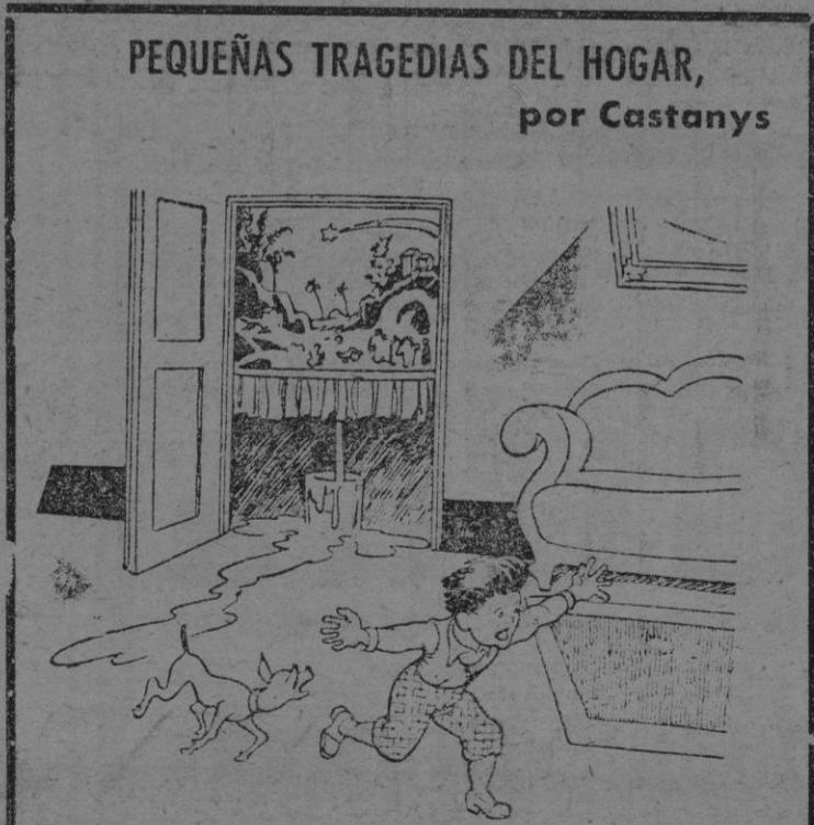
—¡MAMA, MAMA, EL RIO DEL PESEBRE SE HA DESBORDADO!

LEA NUESTRA SECCION DE ANUNCIOS POR PALABRAS