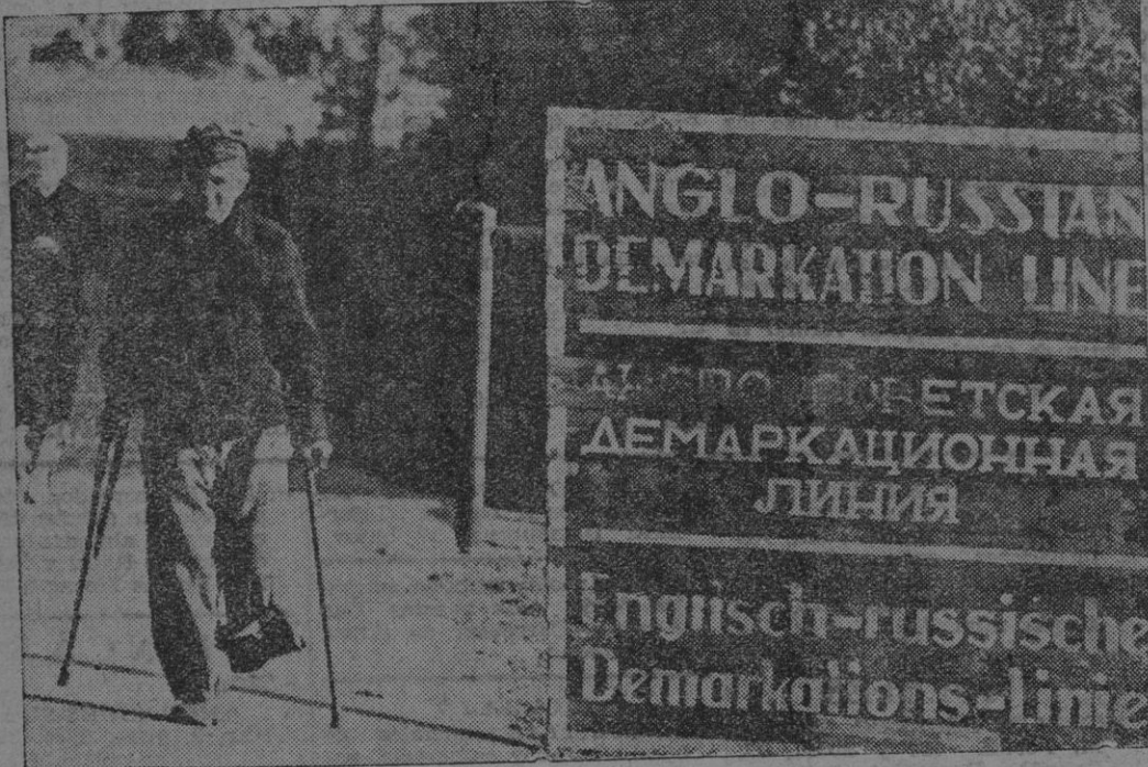
El cartel dice: «Línea de demarcación anglo-rusa», — mutilado que la cruz viene de lejos. Se trata de un excombatiente alemán que ha ido preso en libertad recientemente por los rusos, después de haber caído prisionero en la batalla de Stalingrado. Procedente de esta ciudad, ha cruzado la zona soviética y el objetivo capta el momento en que penetra en la británica, cerca de Lupsck, en la etapa final del largo camino que ha de conducirle — por fin, luego de haber perdido todas las esperanzas — a su hogar.