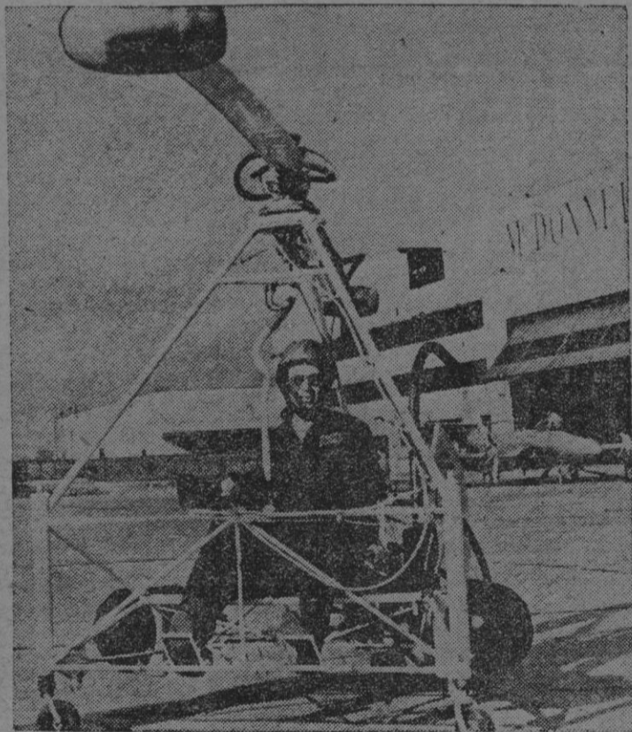
Cabén en cualquier espacio, pueden evolucionar con extrema lentitud, son casi invisibles desde tierra, sólo pesan 300 libras: estos helicópteros del ejército norteamericano son del último modelo, y resultan utilísimos para operaciones militares limitadas, tales como servicios de observación de comunicaciones, explotación de zonas reducidas y correo aéreo.