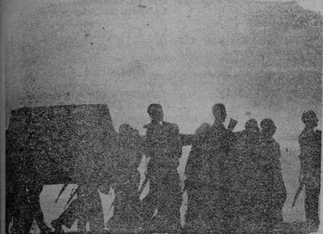
Una bella fotografía del cortejo que llevó el cadáver de José Antonio desde Alicante a la capital de España

Hay hace once años que, cuando nació el alba de una España mejor alumbrada con sacrificio y heroísmo, cayó por Dios por ella José Antonio Primo de Rivera. Durante las horas trágicas, de fango y de lágrimas, él había sido ejemplo y guía de unas juventudes que sentían el desasosiego por las desgracias de la Patria y que, por salvarla del abismo, predicaban la rebeldía salvadora, el darlo todo por que reencontrara su rumbo y su salud.