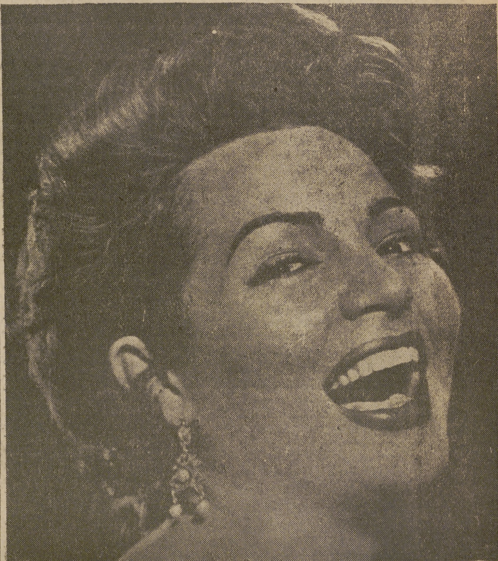
(Comentario en página 5.ª)