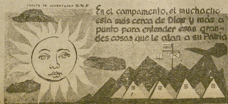
En el campamento, el muchacho está más cerca de Dios y más a punto para entender esas grandes cosas que le dan a su Patria.

Cuando se acabe de construir, la central tendrá cuatro reactores, que generarán 160 megavatios, para suministrar corriente a la red nacional británica. Se espera poner en servicio activo el primer reactor para alrededor de 1959, y los otros tres a intervalos de seis a nueve meses. La central funcionará a toda capacidad para 1961.